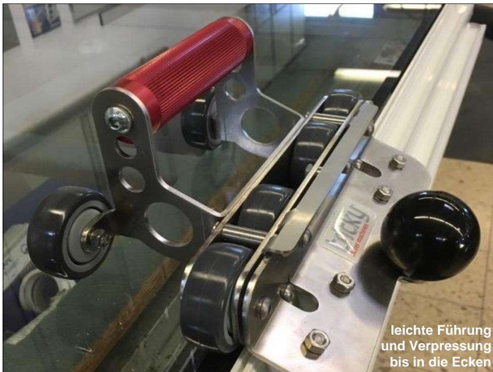
leichte Führung und Verpressung bis in die Ecken

Art.: G4 10 02 Manueller Handroller für sicheres Verpressen des Glaspaketes auf KUBUS Flügel- und Stulprahmen